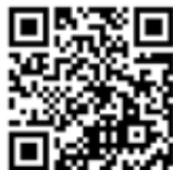
Video zur Fahrzeugbergung

Am Heimweg wurde unser Rüstlöschfahrzeug gegen 17:00 zur Unterstützung der Feuerwehr Wolkersdorf, zu einer aufwändigen LKW Bergung auf der A5 gerufen. Ein Sattelschlepper kam ins Schleudern und blieb schwer beschädigt am Fahrbahnrand stehen. Die dabei verletzte Person wurde mit dem Notarztbuschrauber ins Krankenhaus geflogen. (Vgl. http://www.ffwolkersdorf.at )